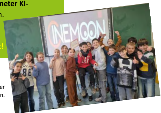
Die 5R2 jubelt über ihren Klassengewinn.