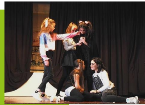
Theater AG der LUS – mitfinanziert durch den Förderverein.

Technik & Co. In Technikfragen und bei der Filmbearbeitung unterstützt zur Freude aller das Kulturhaus Osterfeld . Damit ist für professionelle Dreharbeiten bestens gesorgt.